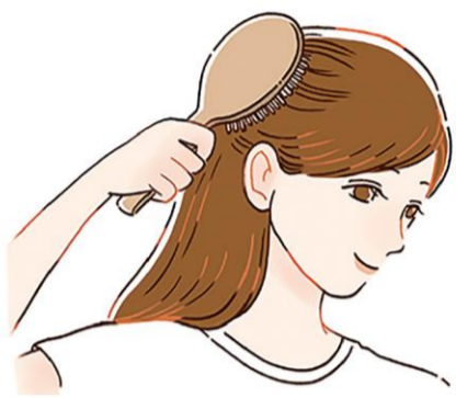
洗髪前にはブラッシングをすることで、髪の絡まりを解消し、シャンプー時の摩擦を軽減したり、洗髪中に髪が引っかかって抜けることも防げます。

シャンプー前にシャワーですすぐ、つまり予洗いをすることで、汚れの大半は落ちると言われています。シャワーの水流を利用し、地肌をよくすすぎ、髪は優しくなでるように洗いまししょう。そもそもシャンプーは、地肌を洗うことが一番の目的。手で泡立ててから使いましょう。髪で泡立てようとすると摩擦で髪が傷む一因に。シャンプーをそのまま地肌につけると、頭皮が乾燥する恐れがあり、湿疹やフケの原因になります。シャンプーを適量取ってお湯を少したらし、両手で空気を含ませるよう