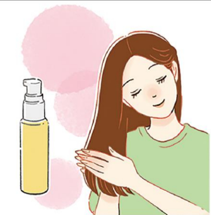
ヘアオイルは朝にもおすすめ！紫外線や乾燥から髪を守ってくれます。スタイリング剤代わりに使ってもOKです

よって、トリートメントの後に使うのも良いですね。パサつきが気になる際の強い味方がヘアオイル。ドライヤーの熱からも守ってくれます。洗髪後、水気を十分に取ったら、適量を手に取り、手のひら全体に伸ばして毛先や襟足、髪の内側などにつけます。手に余ったら、髪全体につけましょう。