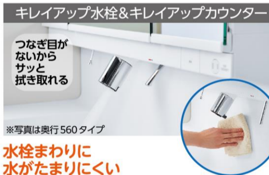
クレイアアップ水栓&クレイアアップカウンター

新しい日常の暮らしに寄り添った洗面ドレッサーが誕生しました。モノをたっぷりしまえる奥行560タイプとコンパクトなサイズの奥行500タイプがあります。