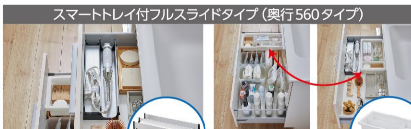
スマートトレイ付フルスライドタイプ (奥行560タイプ)