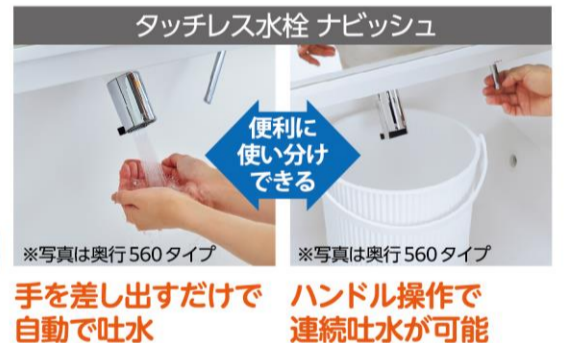
タッチレス水栓 ナビッシュ