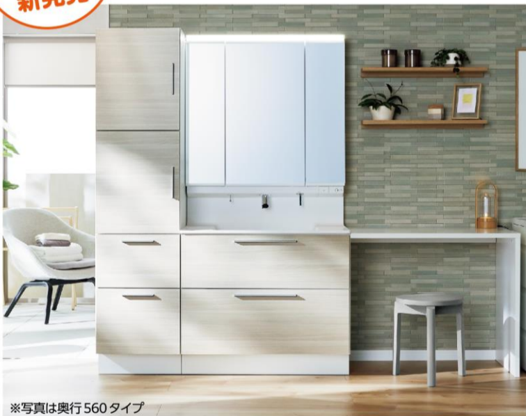
※写真は奥行560タイプ

新しい日常の暮らしに寄り添った洗面ドレッサーが誕生しました。モノをたっぷりしまえる奥行560タイプとコンパクトなサイズの奥行500タイプがあります。