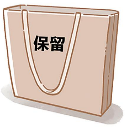
捨てられないときは、別の場所に一時保管して判断を。半年～1年放置状態なら手放しやすくなります。

が高いな」と感じたら、引き出し1つ、カゴ1つから始めてみましょう。まだ食べられるものはカゴや引き出しに戻す。これを時々、少しずつ続け、ある程度見極めが終わったら、乾物、インスタント、レトルト、お菓子という感じで分けられれば、見やすくなり、ムダ買いも減ります。