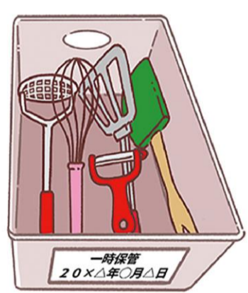
保留のモノはその入れ物に整理した日付を書くと、どれくらい置いたか確認でき、処分の目安になりますよ。

文房具もおすすめ。家の各所にペンやさみなどが置かれていませんか？それらを集めて、すべて広げてみましょう。リビングやキッチンなど、ペンやさみはいくつ必要か、行動を思