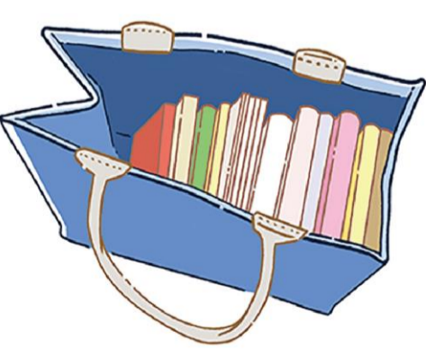
デザインが気に入ってるけど外出にはもう使えない...というバッグは収納アイテムとして活用する手も!

い返して残し、あとは処分しましょう。迷ったら、身近に置いて使い、自分の気持ちに聞いてみると良いですね。ファッションのモノも気になります。が、洋服は大量にあると大変。そこで、靴なら洋服より収納スペースが比較的にコンパクトなので、すべて出しやすいのではないのでしょうか？靴は履かないと自然と劣化する場合も。確認して、かかとや中敷きがすり減ってい