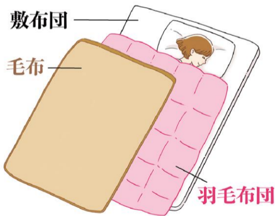
羽毛布団と毛布を使うときは、毛布を上にした方が羽毛布団の保温機能を十分に活かせます。

また、胃腸を動かすことで自然なお通じを促したり、自立神経の動きを良くするといった効果も期待できます。