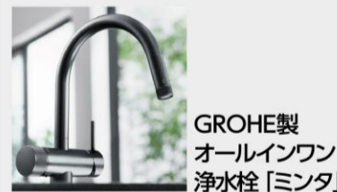
GROHE製オールインワン浄水栓「ミンタ」