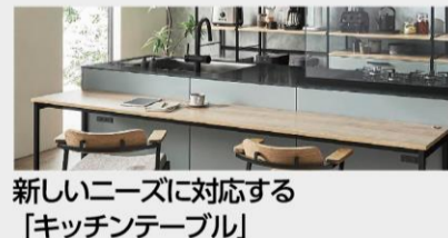
新しいニーズに対応する「キッチンテーブル」