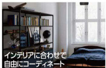
インテリアに合わせて自由にコーディネート