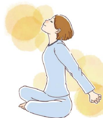
イラスト②ストレッチは一つの動きにつき、10〜15秒程度が目安。無理のない範囲で行いましょう。

起きてからのストレッチは、仰向けになり、手を組んで上にあげ、手足を伸ばしてキープし、その後脱力。3〜5回繰り返しましょう。あぐらをかくか、椅子やベッドに座つ