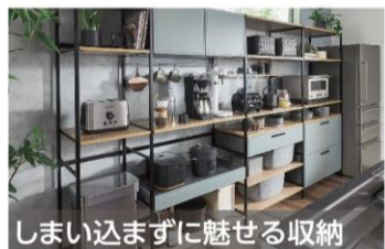
しまい込まずに魅せる収納