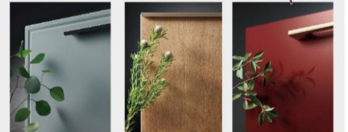
豊富な扉カラー・取手