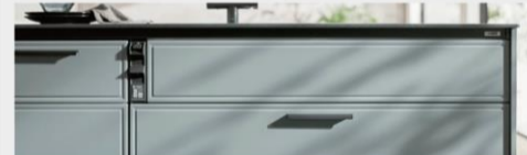
洗練されたデザインの「スリムデザインワークトップ」