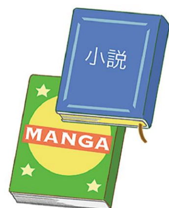
マンガや本などがあると、不安を紛らわせることにひと役買います

を見つけてストックしておけば、使うときに少しでも気分を上げることができるかもしれません。 避難中の時間を過ごす娯楽的なアイテムもあると良いですね。たとえば、トランプや、折り畳み式の小さい将棋盤セット、オセロセットなどは電力を使わず遊べて、コンパクトに収まるのでおすすめです。 夜は、不安や慣れない環境でなかなか寝付けないこともあるでしょう。そこで、アイマスクや耳栓があると助かります。