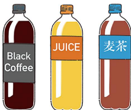
お気に入りのジュースやコーヒーがあると、慣れない場所でも少しほっとできるそうです

避難所で過ごす場合、肌に着けるものも普段と同じものがあると良いですね。下着の替えや、女性ならいつも使っている生理用品も必須。着替えることで不快感を軽減することができます。マスクも、大きさやフィット感、顔に当たる素材の感じなど、好みのものであるのではないのでしょうか？ お気に入りを避難袋などに入れておくと安心ですね。