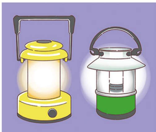
100円ショップにはランタンも豊富にあるので、手軽に取り入れられますね

品。避難所に行った際には、充電待ちで長蛇の列ができたという話もあります。そこで、モバイルバッテリーがあると便利。また、ラジオも大切ですが、今の日常ではインターネットでも聴けることから、ラジオ自体になじまない人も多いそうです。いざという時に「使い方がわからない！」と慌てないためにも、時々聞いてみるのも良いでしょう。