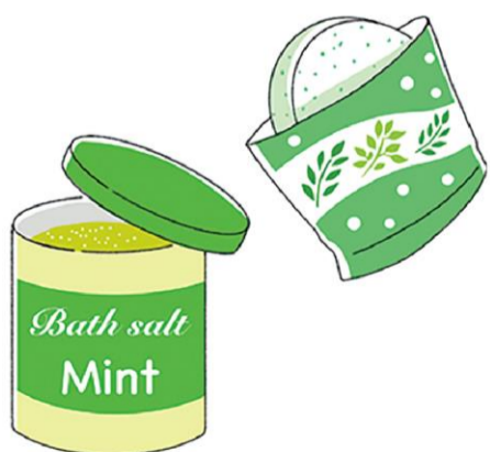
清涼感のある夏向けの入浴剤が豊富にあるのでチェックしてみてください

や、冷凍庫で冷やして使うひんやり枕、首に巻いてひんやりするタオルも節電しながら暑さ対策にもなります。保冷剤をガーゼやハンカチに巻いて首や頭を冷やすのも良いですよ。ちなみに、保冷剤を扇風機に設置して涼しさをアップできるアイテムもあるので要チェックですね。入浴時にメント系の入浴剤を使うとスーッと気持ち持ちは良いです。ハッカ油を浴槽に3〜5滴入れるのもおすすめです。