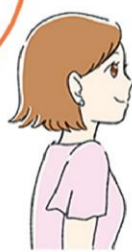
美術館や映画館で涼みながら芸術に触れるのも良いですね！

や、冷凍庫で冷やして使うひんやり枕、首に巻いてひんやりするタオルも節電しながら暑さ対策にもなります。保冷剤をガーゼやハンカチに巻いて首や頭を冷やすのも良いですよ。ちなみに、保冷剤を扇風機に設置して涼しさをアップできるアイテムもあるので要チェックですね。入浴時にメント系の入浴剤を使うとスーッと気持ち持ちは良いです。ハッカ油を浴槽に3〜5滴入れるのもおすすめです。