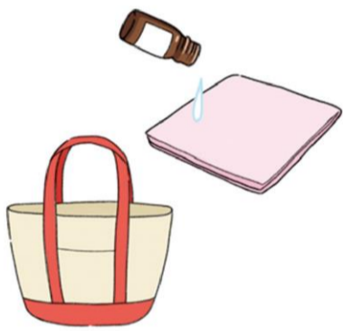
ハンカチに1滴オイルを落とし、嗅ぐのも効果的。外出先にも携帯できますね♪

きなどにも良いそうです。甘く、濃厚な香りのイランイランにも気持ち落ち着かせてくれる効果が期待できます。ほかに、スイートマジヨラムやネロリにもリラククス効果があるとされています。使い方は、香りを拡散させてくれるアロマディフューザーを使ったり、アロマストーンに落とすのもおすすめです。アロマスティックは雑貨店やドラッグストアなどで見られ、手軽に楽しむアイテムとして人気です。