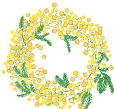
ミモザはリースにしても素敵！インターネットでも手に入るのでチェックしてみては？

ハーブティーや生花で和み、気分を上げよう♪ ハーブティーで味わいとともに香りを楽しむのも良いですね。スッキリとした味わいのカモミールや、最近、シロップもよく見かけるエルダーフラワーは、鎮静効果があると言われています。 ハーブティーの淹れ方は、ティースプーン1杯をポットに入れ、95℃程度のお湯を静かに注ぎ、フタをして3〜5分蒸らしてからカップに注ぎましょう。ハーブティーはきれいな色も魅力。ぜひ、耐熱ガラスのカップで楽しんでみてください。 生花もおすすすめ！自然ならではの繊細で鮮やかな見た目と香りに気分が上がります。ミモザは、黄色い小さな花がかわいく、葉っぱの表情とも相まって、とっても華やか。ざっくり