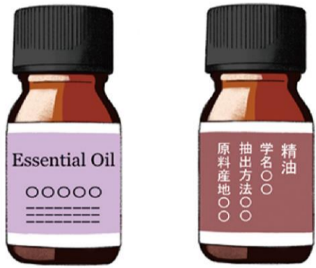
茶色などの遮光瓶に入り、表示に「精油」や「エッセンシャルオイル」とあるので、確認してみましょう

新たな環境で生活を始める人が多い時期でもありますね。不安な気持ちをやわらげる香りで癒されましょう。ラベンダーはリラククスを誘う香り。ベルガモットやグレープフルーツなどの柑橘系の香りはさわやかで、リラククスはもちろん、イライラすると