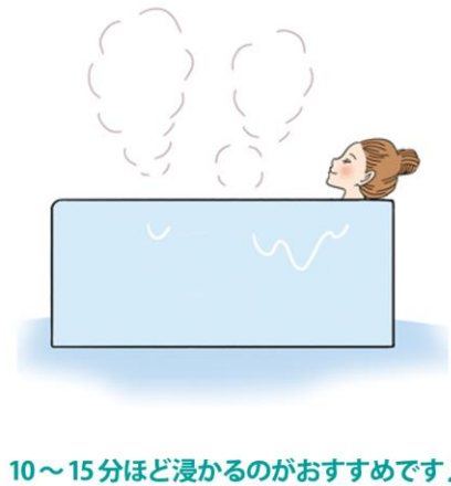
10〜15分ほど浸かるのがおすすめです♪

かからず、筋肉もゆるんでリラックスできます。ぬるく感じるかもしれませんが、ゆっくり浸かると、体がぽかぽか温まりますよ。